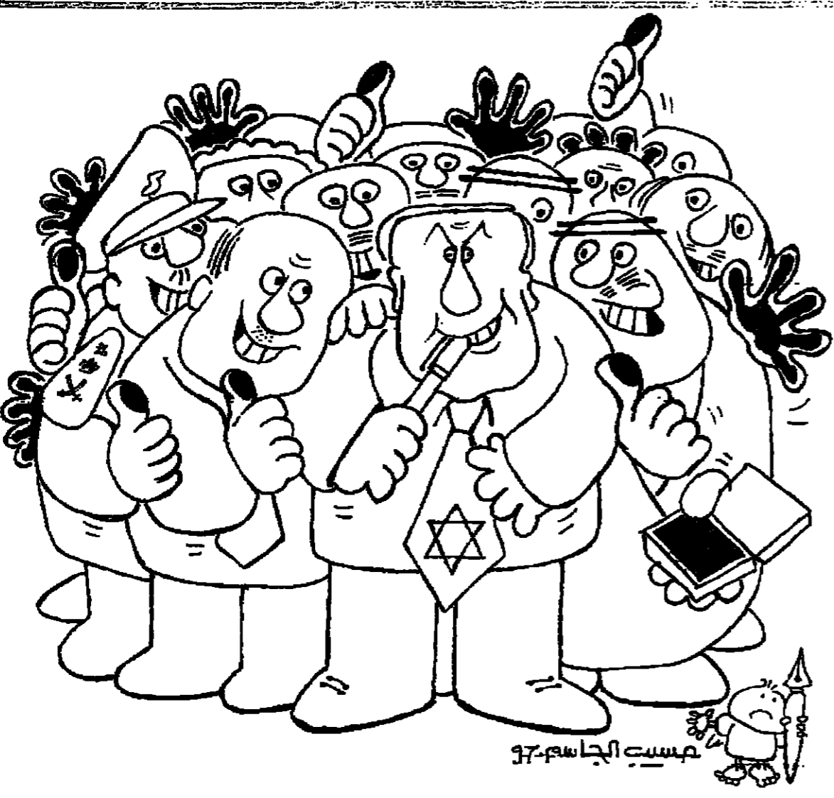
مجلس الجاسم 37